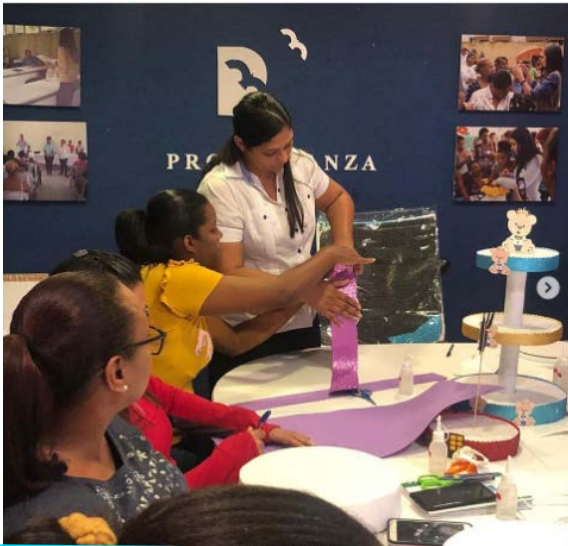
Taller Porta Cupcakes y Paletas