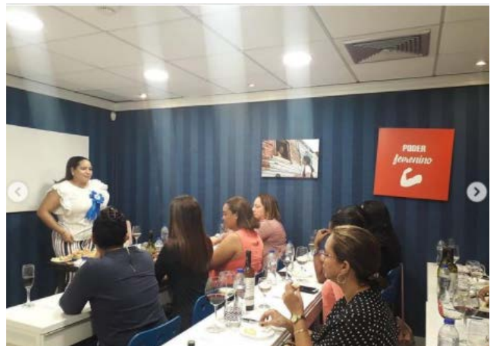
Taller Introducción al Vino