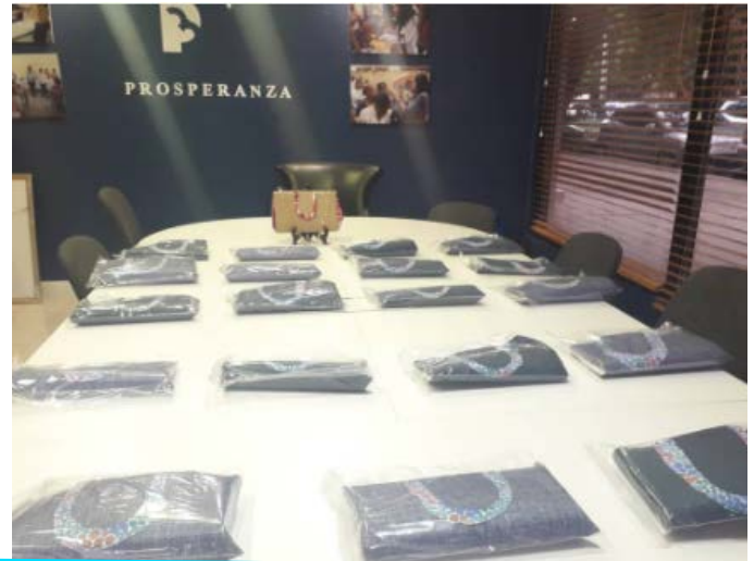
Taller de Cartera sin Costura