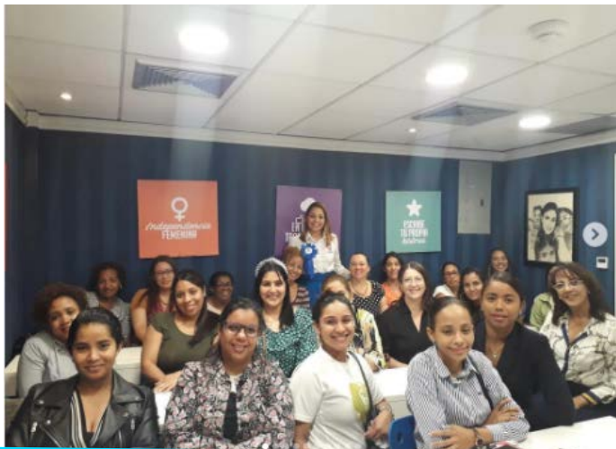
Taller planificación de metas