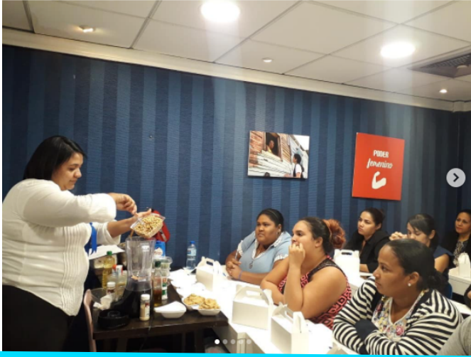
Taller dips y cremas impartido en nuestro Centro Prosperanza