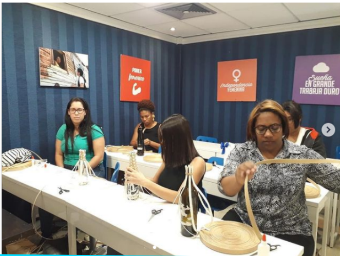
Taller artesanía y flejes impartido en nuestro Centro Prosperanza