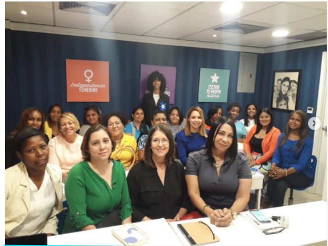
Taller de Redes Sociales impartido en nuestro Centro Prosperanza